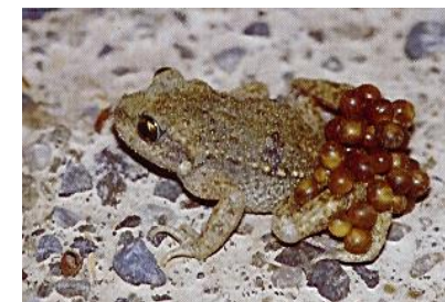
Eier tragendes Männchen der Geburtshelferkröte

Da Fische an diesem künstlich geschaffenen Standort nicht vor-kommen, konnte sich eine beachtliche Amphibien-Population entwickeln: Die häufigen Arten Bergmolch, Erdkröte und Grasfrosch kommen, teilweise schon vor dem Winter und nach der Schnee-schmelze in grosser Zahl zum Weiher, um ihre Eier abzulegen. Die sich von der Kaulquappe zum Landtier wandelnden Jungtiere